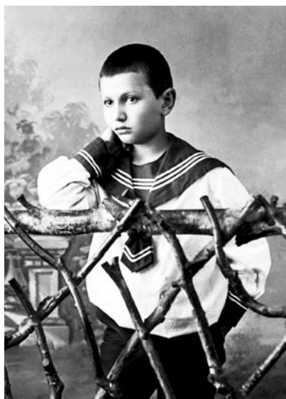
Ленинград. Самсон Кутателадзе — школьник (1924 г.).

В 1933 году он осуществил первое комплексное моделирование теплового режима подземных трубопроводов горячей воды на мелкомасштабных моделях. Это была актуальная физико-техническая проблема, связанная с бурным строительством в стране крупных теплофикационных систем. Затем в 1935 году им была представлена модель свободного турбулентного течения у твердой поверхности с введением понятий о вязком подслое с собственным значением числа Рейнольдса и струйном течении во внешней области потока.