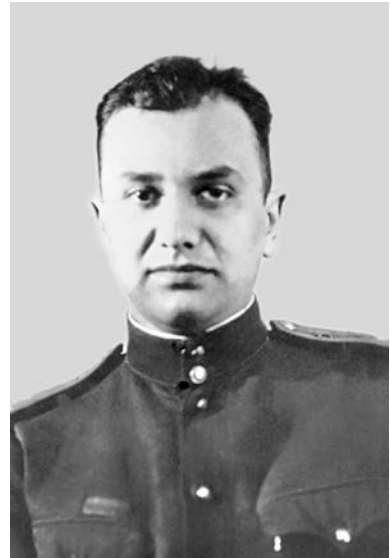
Самсон Кутателадзе — старший техник-лейтенант (1945 г.).

Из писем С.С. Кутателадзе жене с фронта: «Моя дорогая Лидочка!... Случилась маленькая неприятность — я во время атаки был ранен в бедро и лежу сейчас в госпитале. Рана пустяковая и скоро пройдет. Проверку боем я прошел и нервы оказались хорошими, так что все в порядке... Город Ленинград спокойно и твердо кует победу. Да, нас ленинградцев, никакие фашисты взять не могут. Лидочка, представляешь, как мы с тобой встретимся, когда окончится война, у меня от счастья голова кружится при мысли об этом. А там займемся наукой. Очень я по ней соскучился. Привет всем, в том числе и ЦКТИ...» (письмо от 30 июля 1941 г.); «... Изумительны наши успехи на юге. Катастрофа для немцев, о которой говорил Сталин, приближается к ним очень близко. Радостно сознавать, что вера в правое дело, которая нас все эти годы поддерживала, полностью оправдалась. Увидишь, Лидочка, что из этой войны мы выйдем неизмеримо сильнее и богаче, чем когда вступили в нее...» (письмо от 13 июня 1944 г.); «... Кажется, после войны мне придется снова начать учить физику, может быть, я успею еще что-то сделать для науки... Нет, ты не думай, что я жалею об отсутствии у меня всяких дипломов и ученых степеней. Это вещи, которые делают жизнь, конечно, комфортабельней. Но я ведь знаю себе цену. Может быть, из меня не вышло такого ученого, каким я думал стать, но все же кое-чему я научился ведь...» (письмо от 27 июля 1944 г.).